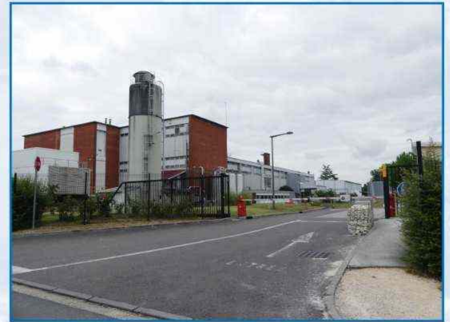
Chocolaterie CEMOI à Bègles

Depuis les années 60, toutes les communes riveraines développent des zones d'activités industrielles, en général éloignées des cours d'eau, mais proches des voies de circulation routières.