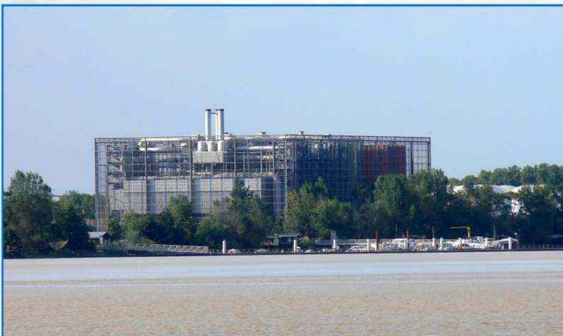
Usine d'incinération ASTRIA à Bègles