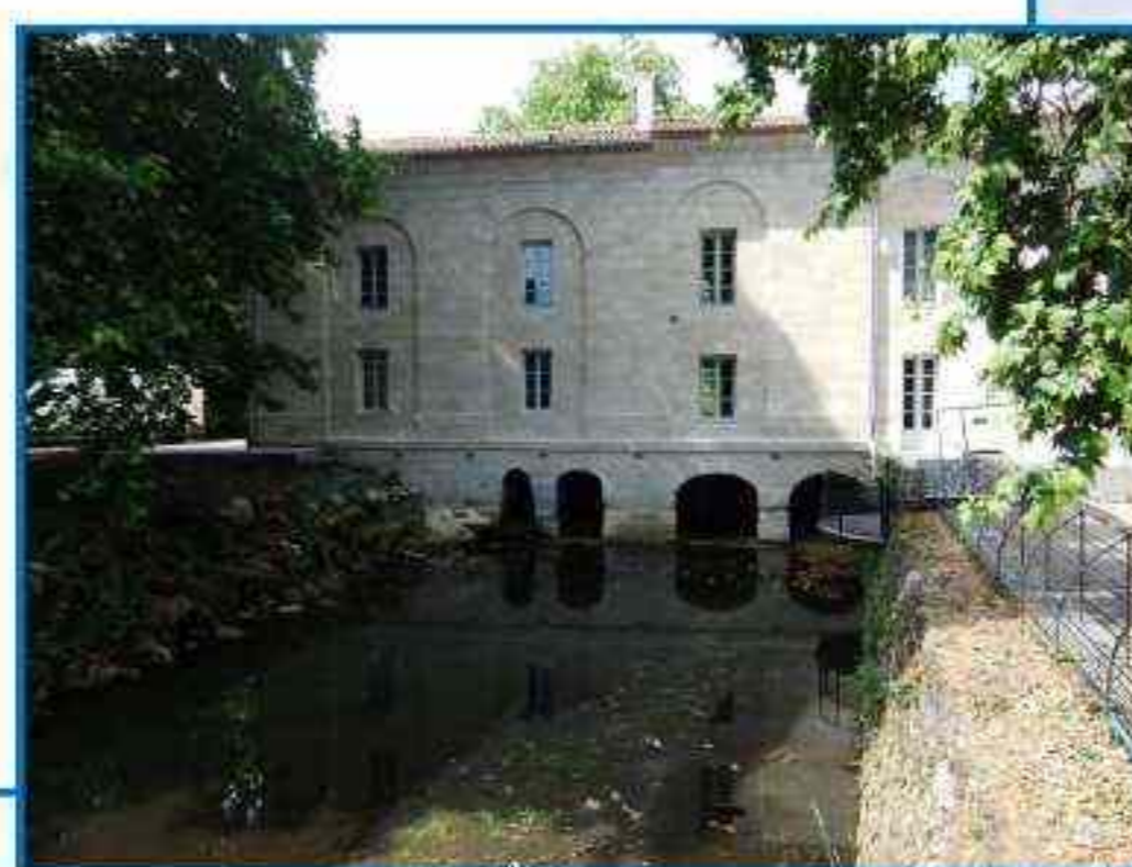
Le moulin de Monjous à Gradignan