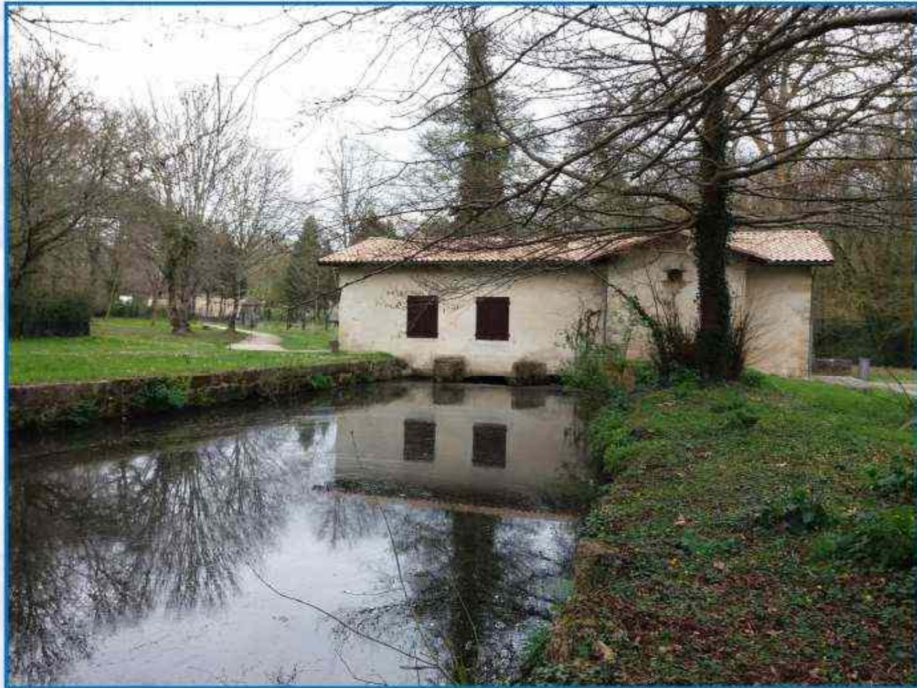
Le moulin de Rouillac à Canéjan