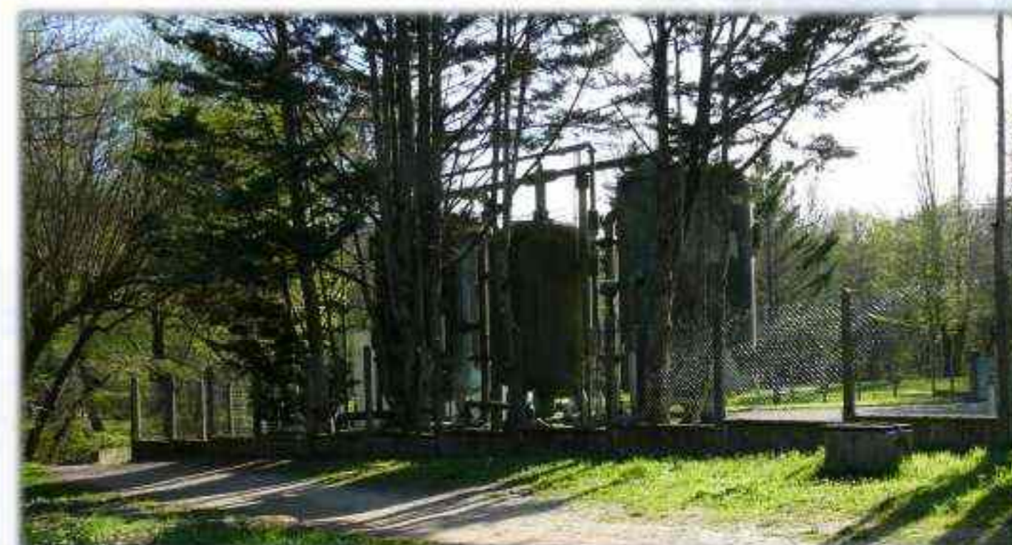
captage industriel de ROUILLAC CANEJAN datant de 1975

Puits, fontaines publiques à usage domestique, captages industriels illustrent l'évolution du besoin en eau.