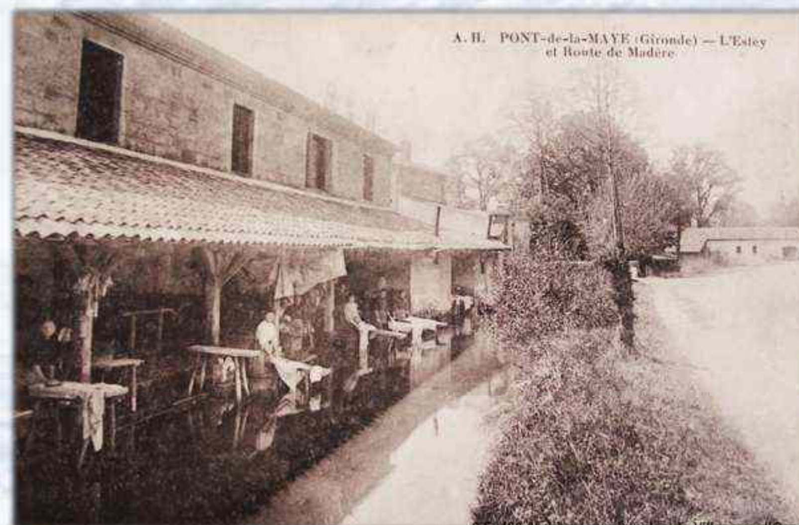
A. H. PONT-de-la-MAYE (Gironde) — L'Estey et Route de Madère.