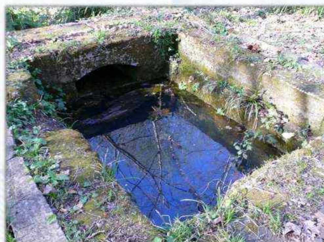
Fontaine de la Vierge en amont de ROUILLAC surmontée jadis d'un édifice

Les sources, précieuses pour leurs qualités vitales et purificatrices ont été souvent associées à des dévotions et croyances.