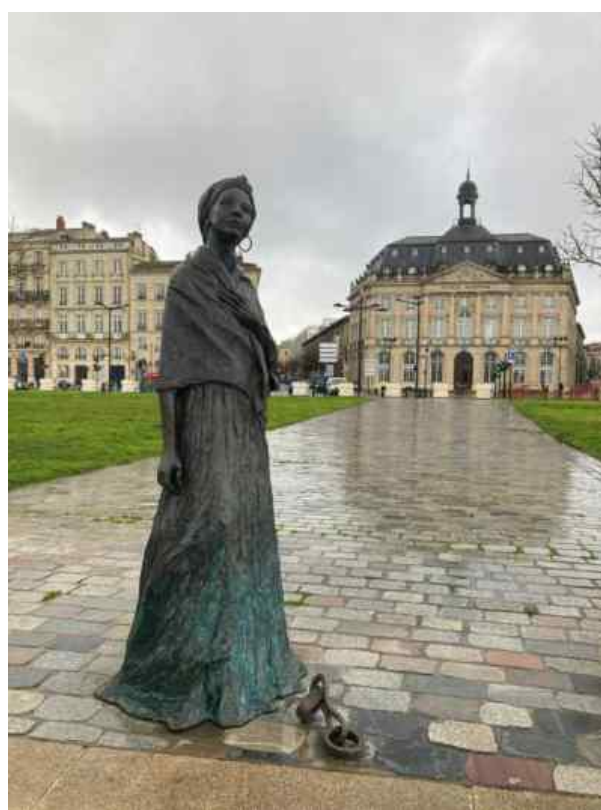
Statue de Modeste Testas par Woody Caymitte.

Le circuit comprenant de nombreux arrêts, fait moins de 2km. Vous pouvez amener un siège léger. A l'issue de la visite, vers 16h, nous pourrons nous retrouver au café Joyeux, 31 rue Ste Colombe (vers Porte Cailhau).