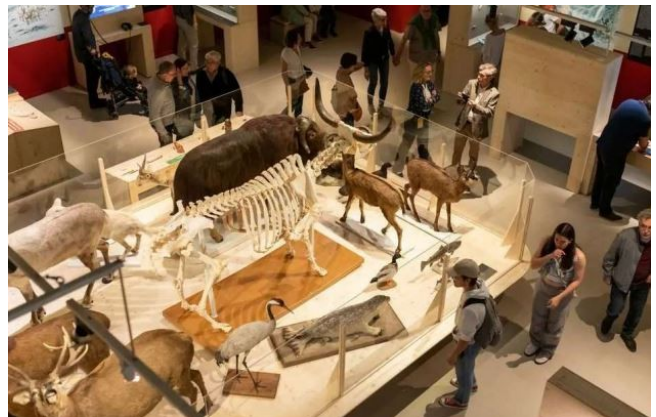
La salle présentant les squelettes et les animaux naturalisés représentés dans l'art préhistorique. (F. Deval/Mairie de Bordeaux).

En remontant 40 000 ans dans le passé, l'exposition présente les chefs d'œuvre de l'art préhistorique provenant des plus grands sites préhistoriques du sud de la France, du nord de l'Espagne et du Portugal. Avec pour principal prêteur le musée d'Archéologie nationale - domaine national de Saint-Germain-en-Laye, on peut ainsi découvrir un nombre exceptionnel d'objets préhistoriques, certains inédits et d'autres rarement montrés au public français.