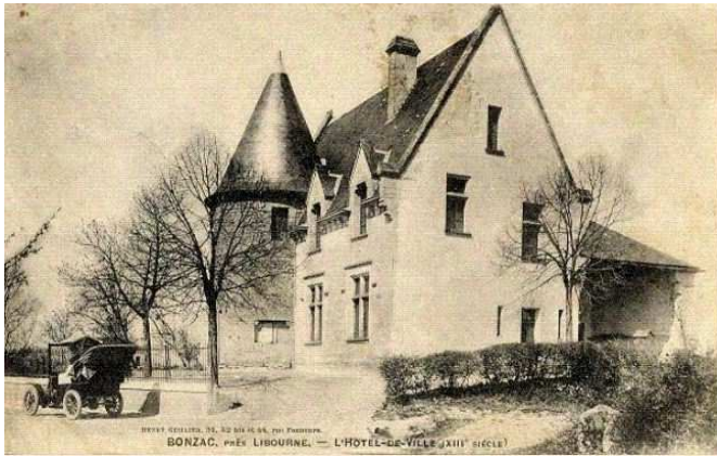
Mairie (ancien moulin) de Bonzac.