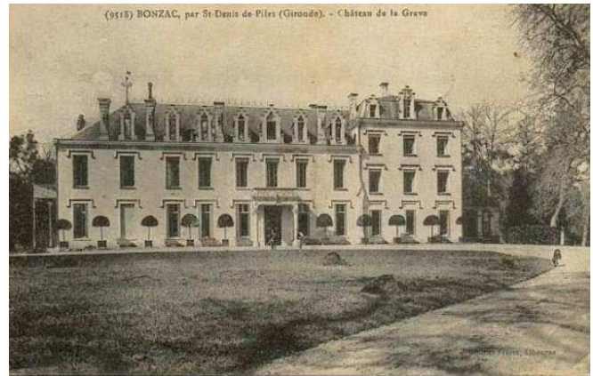
Château de La Grave.

Nous nous dirigeons ensuite vers le château Malfard où nous pourrons pique-niquer et déguster le vin de la propriété. (Possibilité de repli, toilettes).