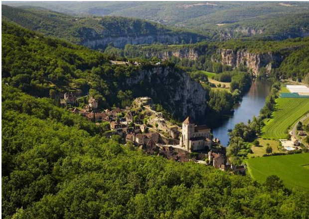
Saint-Cirq-la-Popie : Le village surplombant le Lot.

Village perché sur une falaise surplombant le Lot, ce nid d'aigle a connu une période de prospérité au XIIIe-XIVe dont il reste de beaux bâtiments. Le site a été réinvesti par des artistes au XXe.