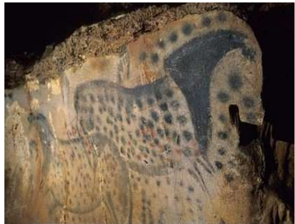
Cabrerets : La grotte de Pech-Merle.

La grotte de Pech-Merle a été ornée durant 3 périodes : au Périgordien (avant 25000), et au Magdalénien entre 25 et 20000 et autour de 14000. On y découvre des peintures de mammouths, bisons et chevaux et des mains humaines en négatif. Un musée y est associé.