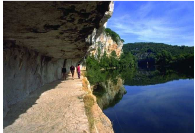
Bouziès : Le chemin de halage sous la falaise de Ganil.

12h45-13h45 Pique-nique (fourni par le gîte) à Saint-Cirq ou à Tour-de-Faure.