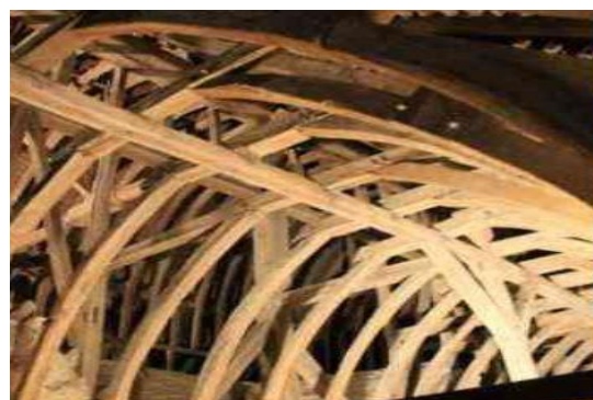
Abbatiale de Guitres.

L'après-midi (vers 14h30) visite de l'église abbatiale de Guitres et sa charpente. Enfin, visite de l'église de St-Ciers d'Abzac et sa crypte peinte.