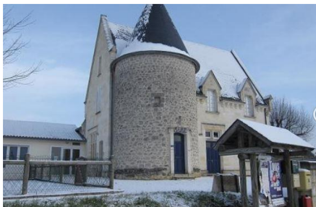
Moulin-Mairie de Bonzac.