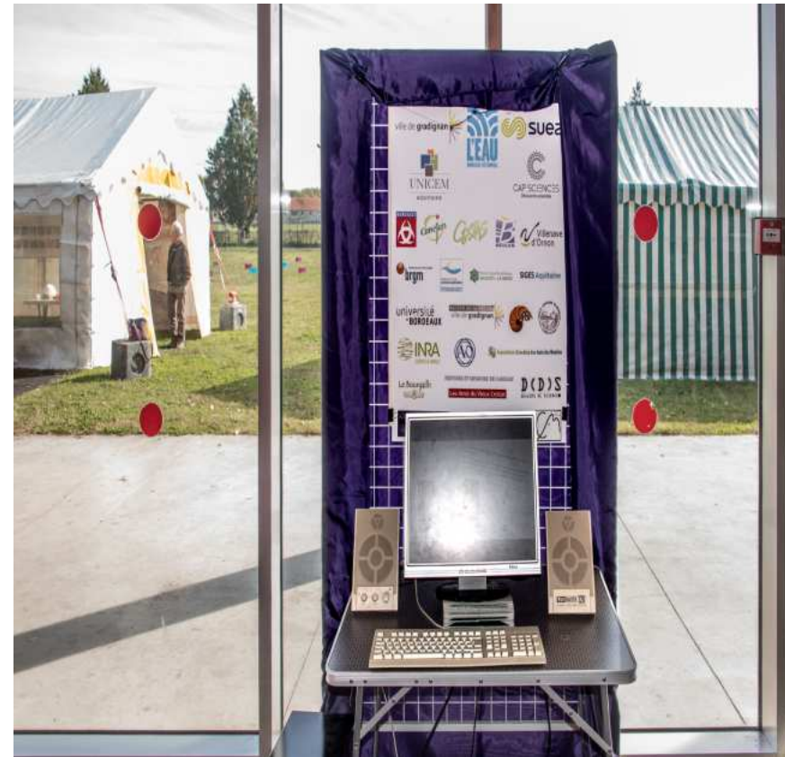
Le long de l'Eau Bourde à vélo