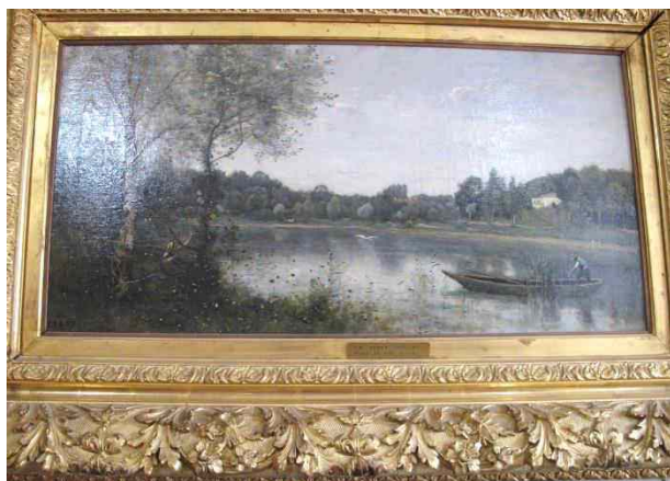
Corot Etang de Ville d'Avray

Pour le xx^e siècle sont présentés deux fonds remarquables : du peintre français Roger Bissière d'une part, et de Claude Lalanne et François-Xavier Lalanne , d'autre part. On trouve aussi une œuvre pointilliste de Francis Picabia .