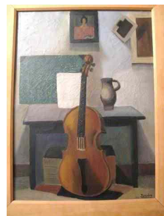
Roger Bissière Nature morte au violoncelle

La section archéologique du Musée est constituée d'objets provenant de sites lot-et-garonnais : la collection des époques celtique et gallo-romaine en constitue un des aspects majeurs. En 2000, la donation Camille Aboussouan est venue enrichir le musée d'une très belle dotation d'archéologie orientale (objets de l' Âge du bronze jusqu'à l'époque des Croisades , provenant du Liban et de Syrie ).